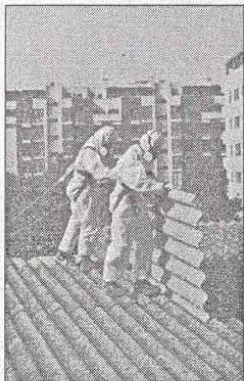
Bonifica dei pannelli di amianto presenti in molte strutture