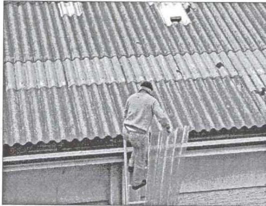
Un capannone con eternit

«La legge n°257/92, che ha messo al bando l'amianto dal territorio italiano - ha affermato Infusini - è giunta con forte ritardo proprio per le pressioni sul governo italiano che fecero le aziende che avevano già investito nel settore. La stessa legge imponeva alle regioni di adottare i piani di protezione, smaltimento e bonifica dell'ambiente entro 180 giorni a partire dall'entrata in vigore del DPR 8.08.1994. A distanza di circa 20 anni la regione Calabria, pur avendo promulgato la L. Reg. n°14 del 27.04.2011 (che non prevede alcun contributo ai privati per interventi di bonifica