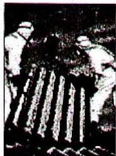
La rimozione di una lastra di amianto

«Il convegno è rivolto - conclude Infusini - ad Amministrazioni Pubbliche, aziende proprietarie di edifici o capannoni con coperture in amianto, privati cittadini che abbiano rilevato la presenza di materiale contenente amianto (MAC) nelle costruzioni o nei terreni, amministratori di condomini con presenza di MAC, imprese di manutenzione, rimozione, bonifica, trasporto di MAC; associazioni ambientaliste, lavoratori esposti o ex esposti all'amianto».