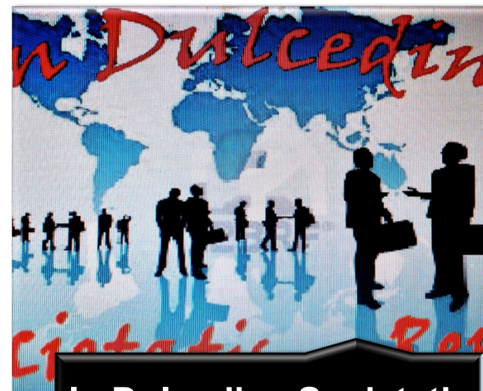
In Dulcedine Societatis Rende