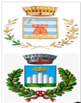
Comune di Montalto, Comune di Rose