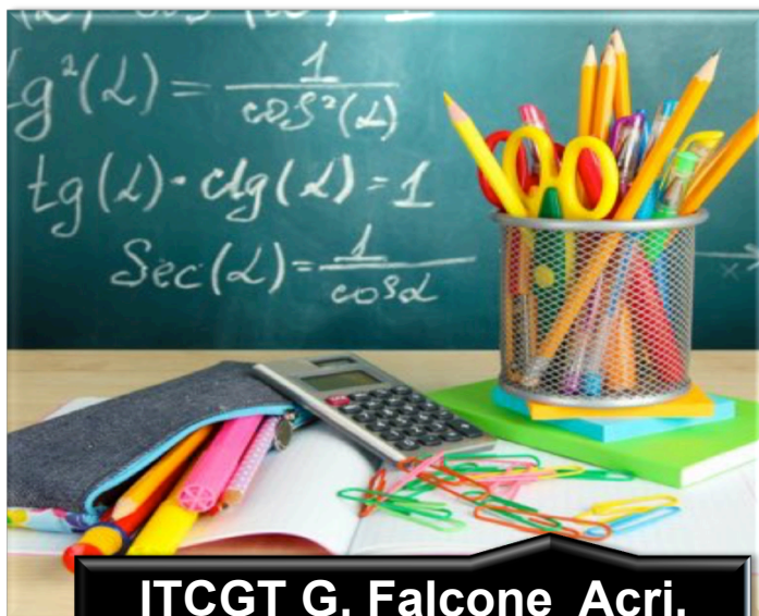
ITCGT G. Falcone Acri, IIS IPSIA Marconi Cosenza